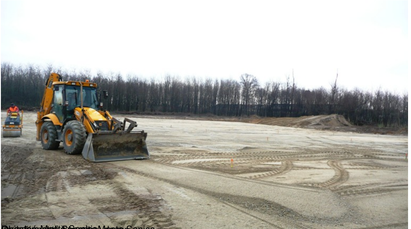
Dopravný územie v Senici