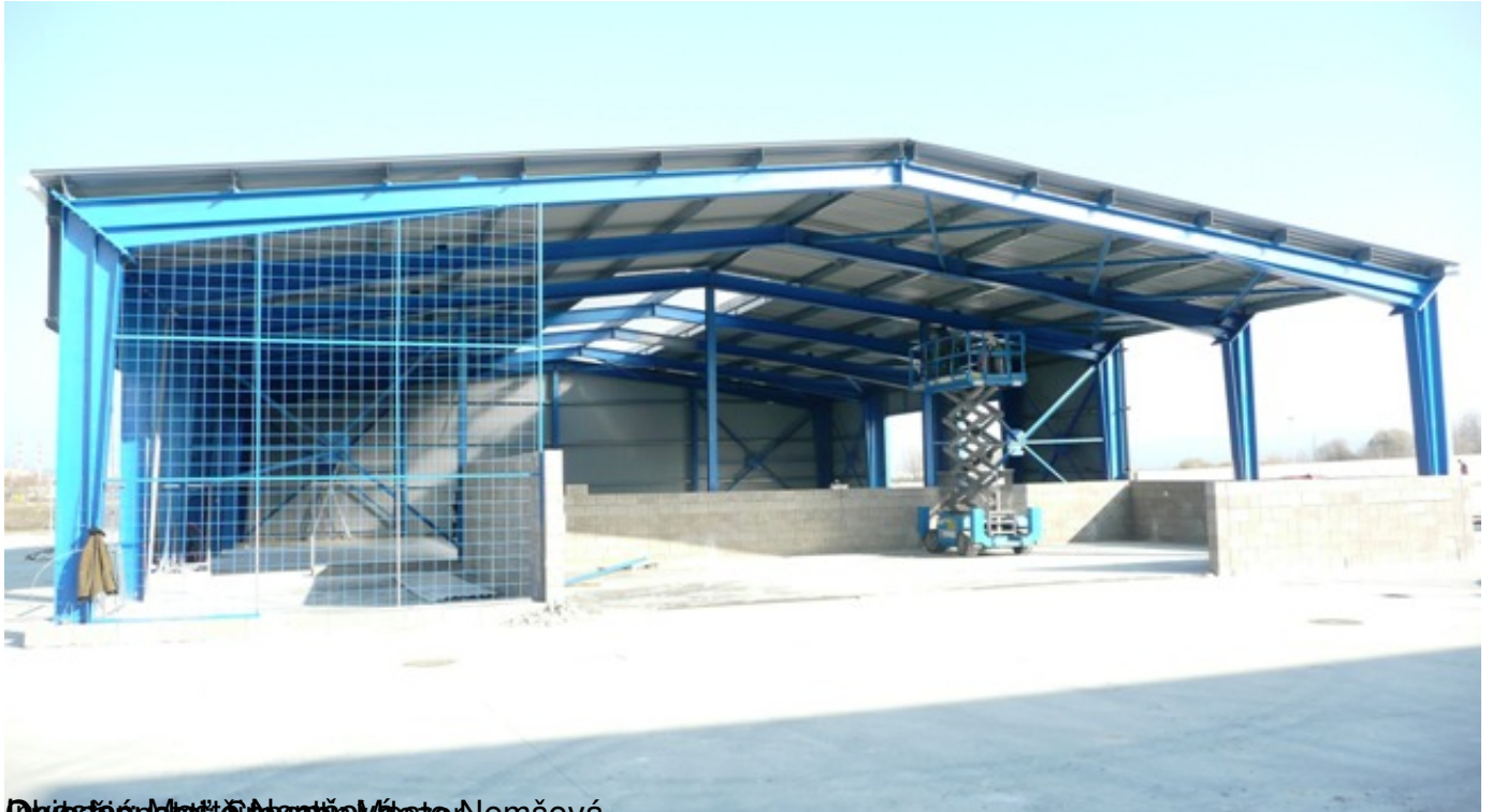
Dopravný stánok v mestskom území Nemšová