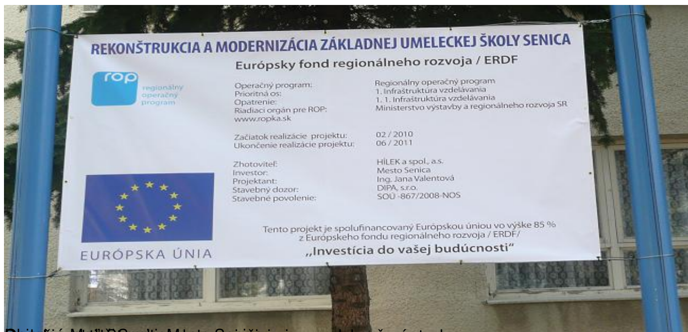
Obec: Mesto Senica, Mesto Senica, Senica Dielo: Odkaňovanie zdrúzených obcí Viesky Projektant: Mesto Senica, Senica