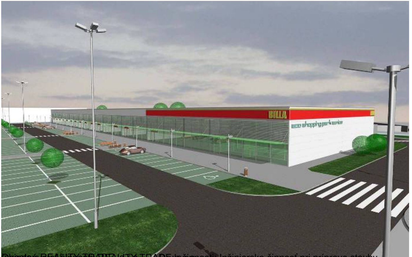
Objekt: BEAUTY TRADE, S.T.O. TRADE, s.r.o. Inžinierska činnosť pri príprave stavby